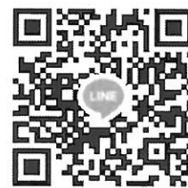
餐飲系技優甄審 QR Code