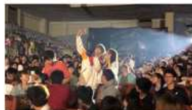
與歌手近距離互動