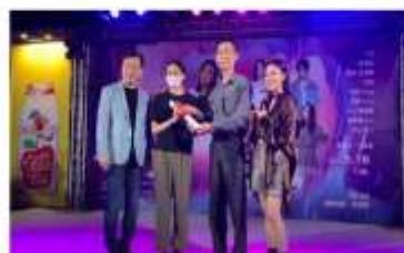
相信音樂專場演唱會抽萬元獎學金