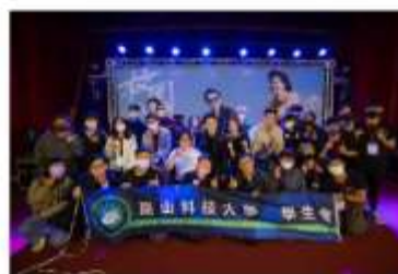
脫口秀校園巡迴場