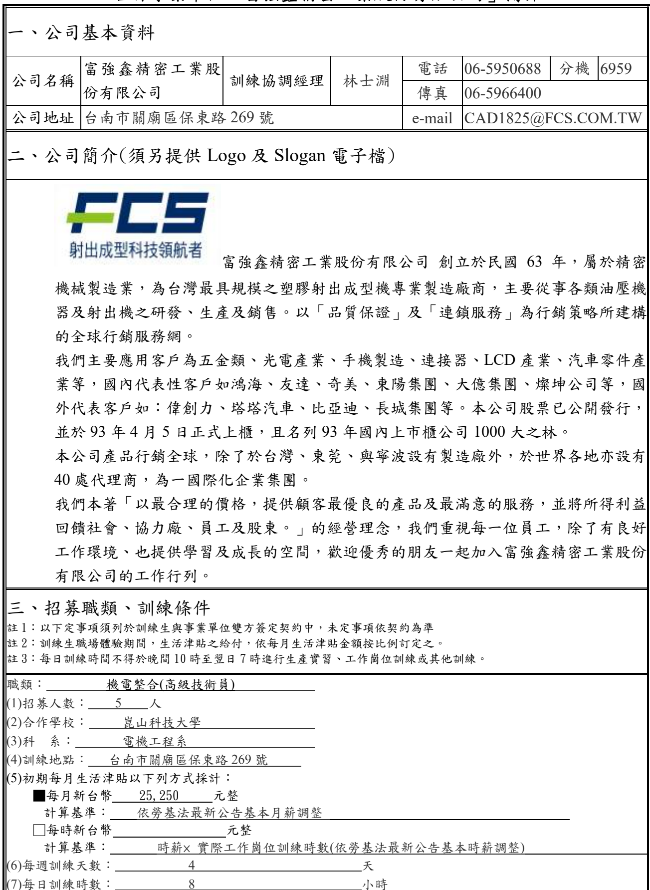
表 2.111 年度「雙軌訓練旗艦計畫」之「機電整合(高級技術員)」四年制學制 合作事業單位「富強鑫精密工業股份有限公司」簡介