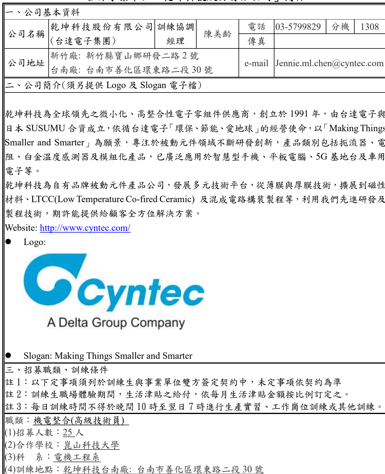
表 1.111 年度「雙軌訓練旗艦計畫」之「機電整合(高級技術員)」四年制學制 合作事業單位「乾坤科技股份有限公司」簡介